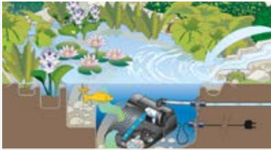
Погружной фильтр Filtral UVC