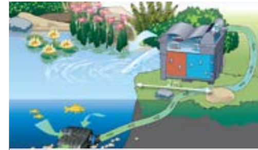
Проточный фильтр BioSmart