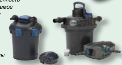
BioPress Set 6000 (CTAPT) FiltoClear Set 12000 (ППО)