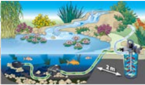
Напорный фильтр FiltroClear Set