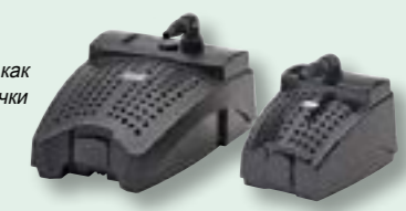
Filtral UVC 5000 (CTAPT) Filtral UVC 2500 (CTAPT)