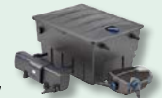
BioTec ScreenMatic Set 40000