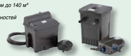
BioSmart Set 5000 (CTAPT) FiltoMatic CWS Set 7000 (ППО)