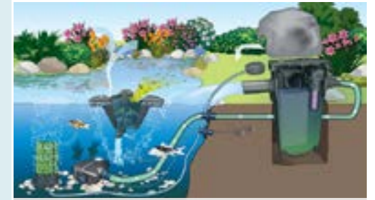
Проточный фильтр FiltroMatic CWS